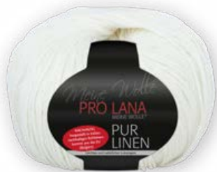
Farbe Nr. 02 natur

100% Leinen Lauflänge 160m/50g Nadelstärke 4,5 – 5,5