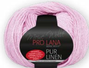
Farbe Nr. 33 rosa