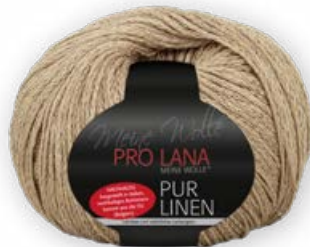
Farbe Nr. 08 sand