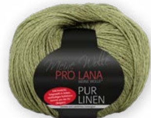
Farbe Nr. 72 oliv