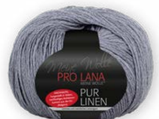
Farbe Nr. 97 grau