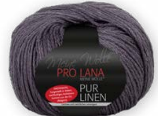
Farbe Nr. 49 aubergine