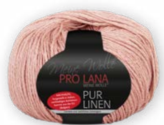
Farbe Nr. 25 rosewood