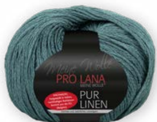
Farbe Nr. 69 petrol