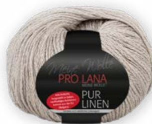
Farbe Nr. 18 nude