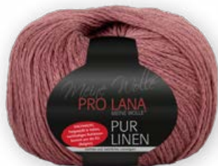
Farbe Nr. 28 terracotta