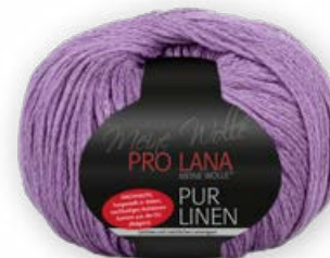
Farbe Nr. 47 violett