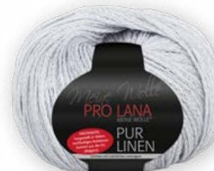
Farbe Nr. 91 nebel